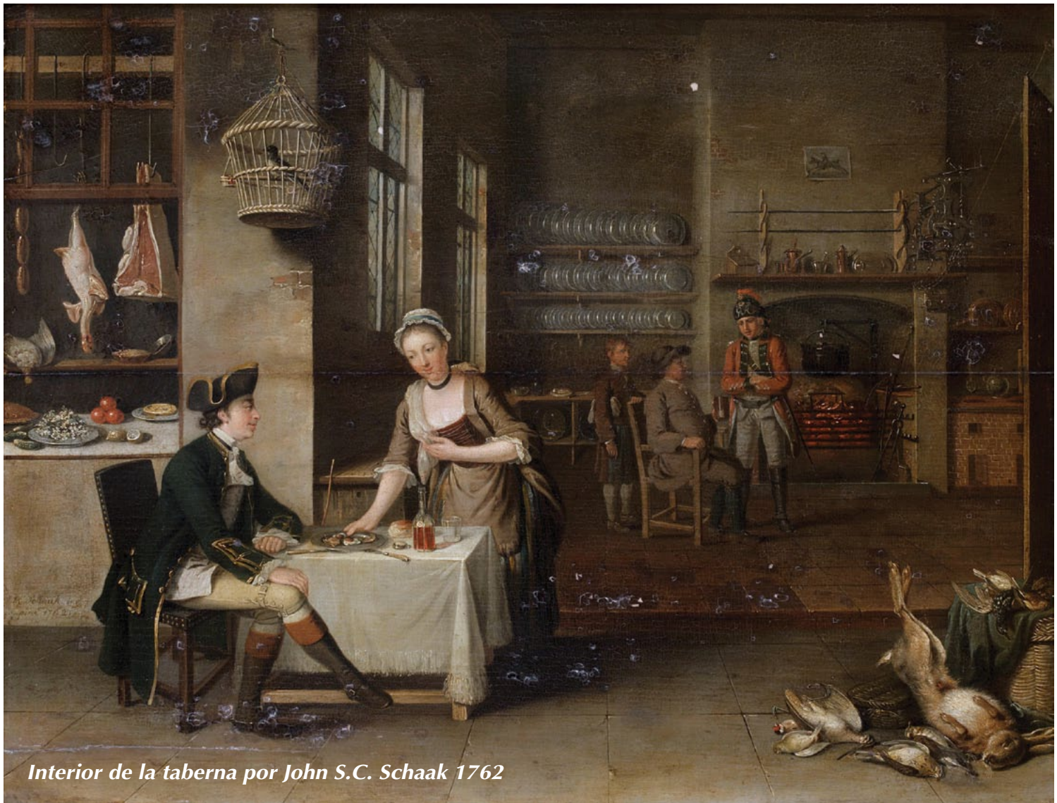
Interior de la taberna por John S.C. Schaak 1762

como esta sólo refuerzan estos sentimientos. El AHC es una parte vital de la vida y la cultura en Arkansas, y yo no podría ser más contento de formar parte de este indispensable grupo de ciudadanos. Así que, supongo que terminaré esta pieza "levantando mi copa" al AHC, ¡y espero con ansias más funciones en el futuro!