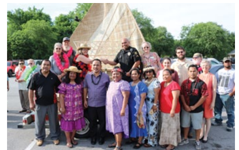
ON THE COVER: Marshallese boat builders pose with the finished craft at the Marshallese Jemenei (Constitution) Day on May 25, 2018.

Want to receive a copy of Connect in your inbox? Just send us an email at info@arkansashumanitiescouncil.org