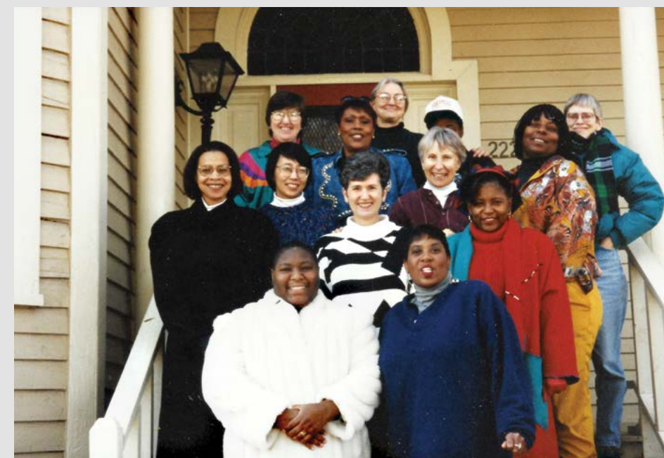
Junta y personal de Women's Project, 1995.

enfoque, una parte clave del proceso de diseño de la exposición fue la participación de un grupo consultivo de antiguos miembros del Proyecto de Mujeres que opinaron sobre todo, desde los colores de la exposición (para reflejar la forma en que se sentía el trabajo y los tiempos) hasta la estructura y el flujo del contenido.