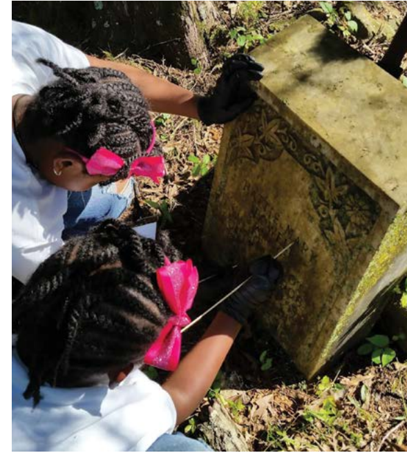
A la izquierda: Mapa de los cementerios incluidos en el Proyecto 365