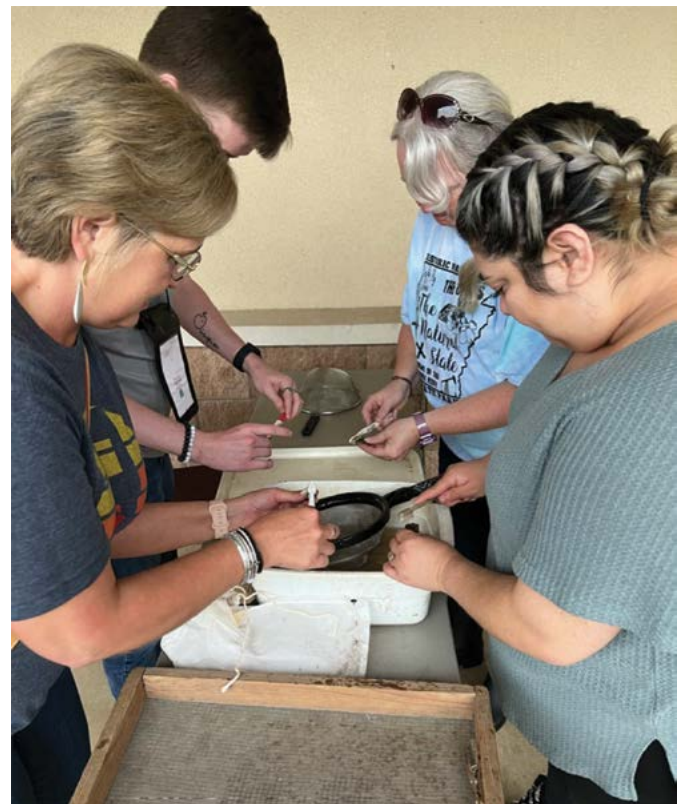
Los participantes en el Instituto de Profesores disfrutaron del Día de la excavación y se sumergieron en la oportunidad de lavar artefactos.