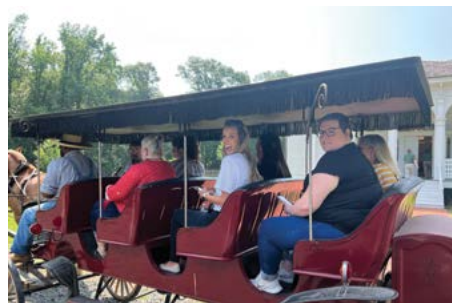
En portada: Profesores disfrutando de un paseo en carruaje durante el Instituto de Verano para Profesores de la AHC en el Parque Histórico Estatal de Washington.

El Consejo de Humanidades de Arkansas: Una retrospectiva ..... 16